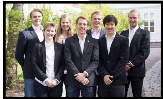
MARM 14/15.