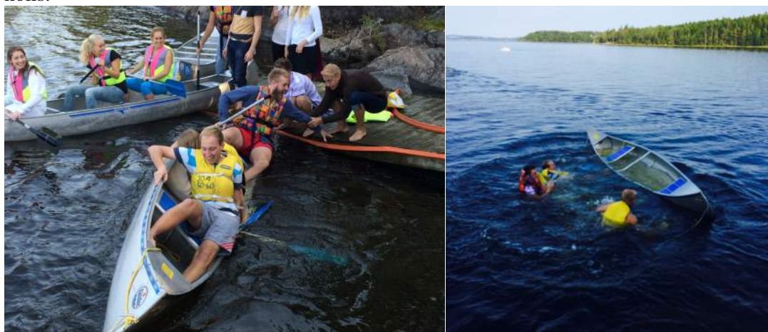
Styrelsen erkänner sig väldigt dåliga på paddla kanot, vi är bättre på styrelsearbete. Bilden är tagen från Nollkollot.

Deltagit under mottagningen, balen, gasquesittningar, tackphadderkalas. Under mottagningen var styrelsen fejknullor på Götaplatsen. Arrangerat en station med hinderbana och "kasta mynt i Bautastenskassan" under Chalmersrundvandringen. Arrangerat en samarbetsstation i Härrydaområdet under bastu-eventet och likaså under Nollkollot. Under mottagningen var styrelsen även sittande på en Gasquesittning och på Nollfinalen där ett fantastiskt stafett-tal hölls.