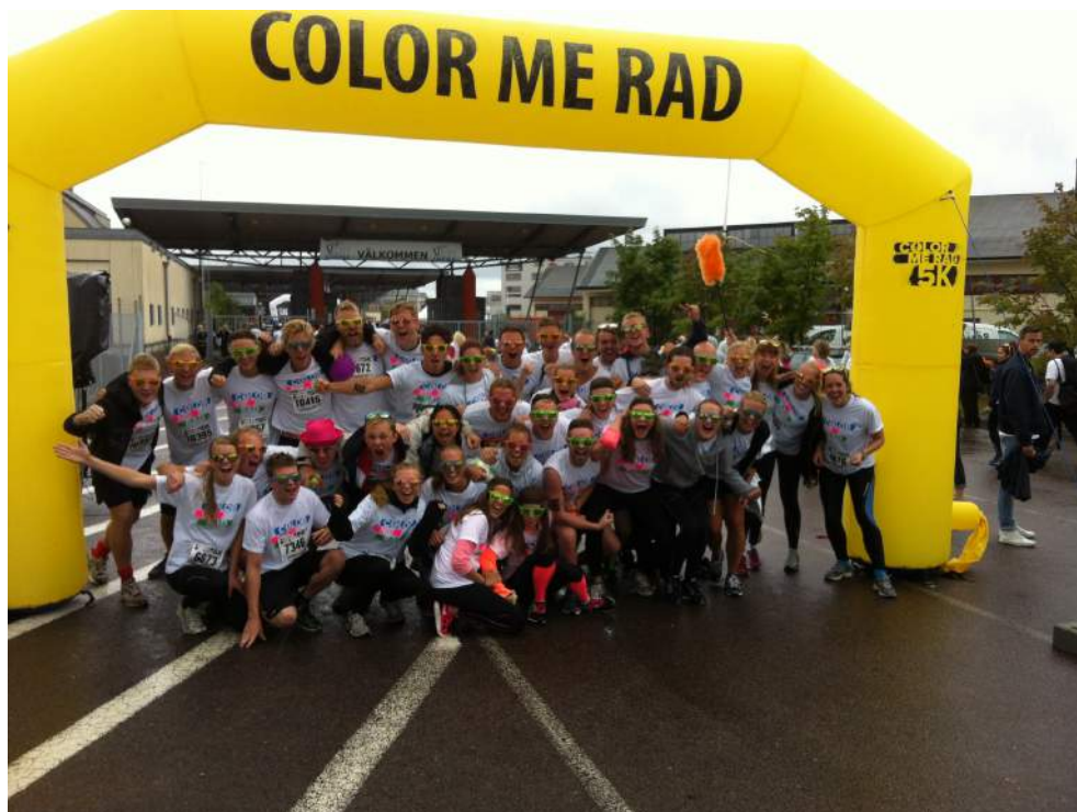
Lagbild från kick-offen då styrelsen och kommittéerna sprang Color-Me-Rad.

Styrelsen har arrangerat en kick-off då styrelsen och kommittéerna sprang Color-Me-Rad och därefter ledde styrelsen en workshop om samarbeten.