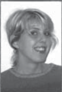
Skribent: Elisabeth Gren