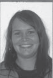
Skribent: Josefin Salén