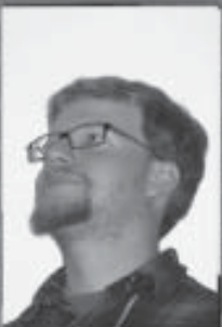
Skribent: Björn Pålsson