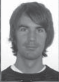
Chefsredaktör: Gabriel Sternberg