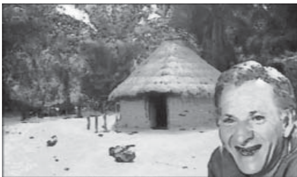
Undran över vad som finns i hyddan gjorde honom förvånadstill. Ja, ni sten lite bit.