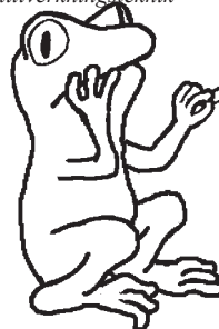
illustration: Olof Winterfjord