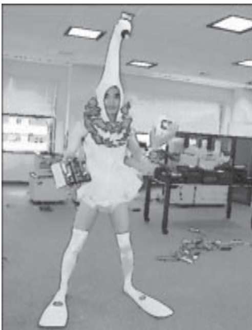
När Tamatsu vaknade upp blev han livrädd! Nåtsladden till datorn var urdragen och det lukade lite illa.